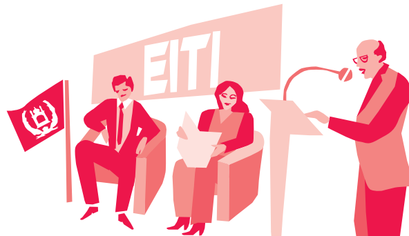
د استخراجي صنایعو د شفافیت په نړیوال نوښت (EITI) کې د افغانستان د پوره غړیتوب په موخه د سلامشورې د خدمتونو عرضه کول

دا پروګرام د افغانستان د کانونو او پترولیم وزارت ته د کان ایستې د نړیوالو معیارونو په پلي کولو کې سلامشوره ورکوي. په دې اړه افغانستان د ۲۰۱۰ کال راهیسې د استخراجي صنایعو د شفافیت د نړیوال نوښت (EITI) د پوره غړیتوب د لاسته راوړلو په لاره کې زیار باسي. دا پروګرام د افغانستان د استخراجي صنایعو د شفافیت د نوښت سره د استخراجي صنعت، دولت او مدني ټولني تر منځ د همکارۍ د ټینګښت په لاره کې مرسته کوي. افغاني نوښت د نوموړي کار د یوې برخې په توګه د ډیالوګ غونډې جوړوي چې په هغو کې د مدني ټولني، دولتي ادارو او خصوصي سکتور استازي ګډون کوي. د غونډو پایلې د هیواد د منرالي زیرمو د پایښتونکي استخراج په باب دولتي ډیالوګ کې شاملېږي. د نوموړي نوښت معیارونه په ملي تګلارو لکه د افغانستان د ملي سولې او پراختیا په چوکاټ کې هم په پام کې نیول کېږي.